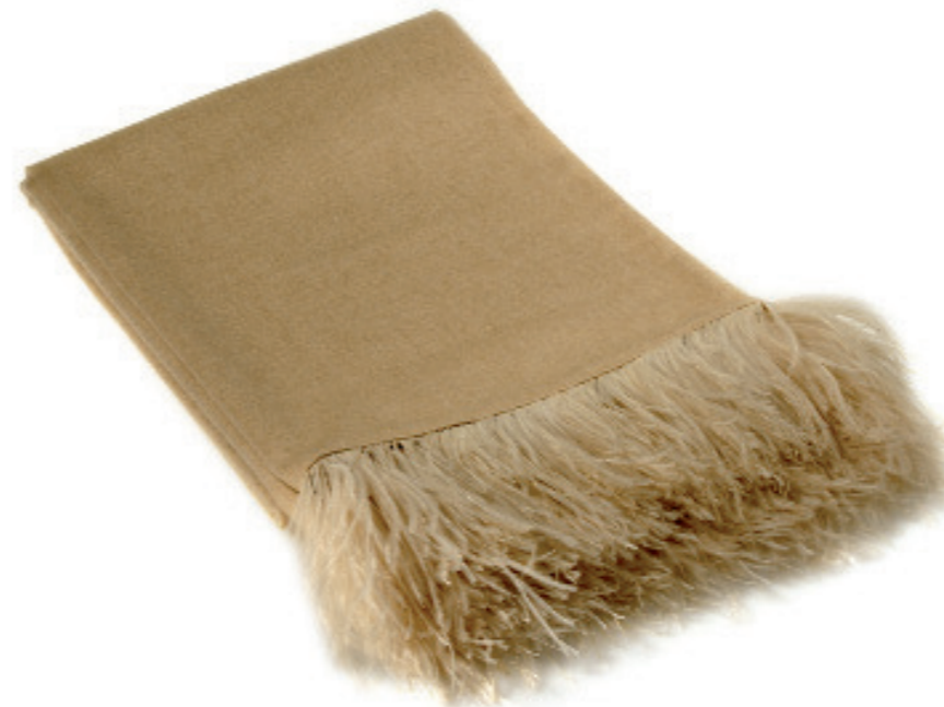
Decke aus 100% Kaschmir mit afrikanischen Straußenfedern Preis auf Anfrage www.KATRINLEUZE.de

Reisetasche aus bedrucktem Ziegenfell in Gepardenoptik